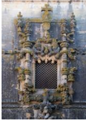
Torre de Belém (Lisboa) e janela manuelina do Convento de Cristo (Tomar).