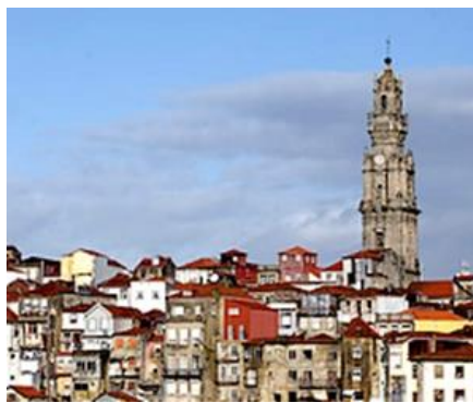
Mosteiro de S. Gonçalo (Amarante) e Torre dos Clérigos (Porto).